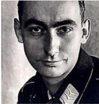
Werner Klemke (1917-1994)