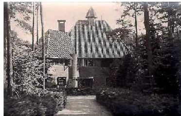
Villa 'De Craaihof' in Blaricum.