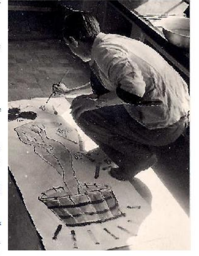
Tekenaar Werner Klemke.